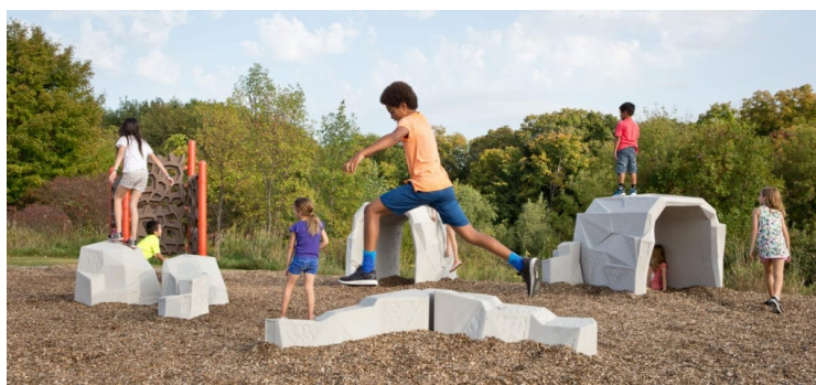
фиг. 2. Примери за подобни реализации