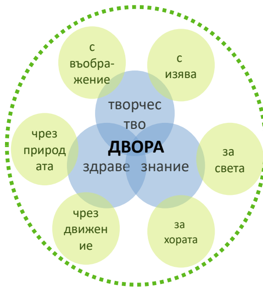
фиг. 1. ДВОРА – визия и теми

Условно наричаме новото пространство „ДВОРА. То ще бъде мястото за игра на децата и срещи на техните родители. ДВОРА ще обединява темите за здравето с движението, зеленината и природата, творчеството с въображението, изявата и музиката, знанието за света и хората, чрез дизайна на елементите. То ще събира и развива общността като активно я включва във всички етапи на създаването и съществуването му.