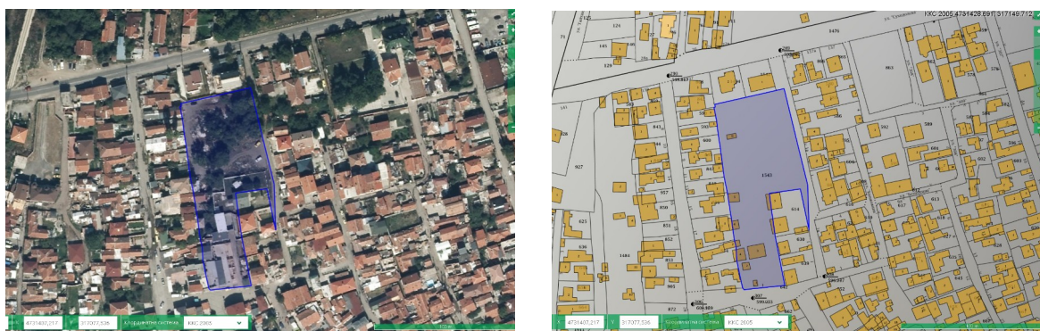
Фиг. 3. Местоположение - орто-снимка и извадка от кадастралната карта. ( https://kais.cadastre.bg/ )

Обект на настоящото предложение е благоустройството на неизползван понастоящем терен в кв. Факултета, гр. София. ПИ 68134.1109.1543 е разположен в централната част на кв. Факултета с лице към ул. „Владимир Куртев“ и на 15 м от ул. „Суходолска“ – главната транспортна връзка на квартала, до Център МИР-Здраве и Социално развитие и в близост до лесопарковата част на Западен парк. Имотът е лесно и удобно достъпен от почти целия квартал.